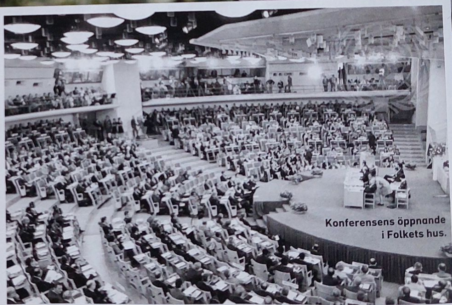
Konferensens öppnande i Folkets hus.

”När jag är optimist hoppas jag på en finansiell kollaps där dollarn blir värdelös.”